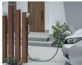
枕木材100角と並べて美しく