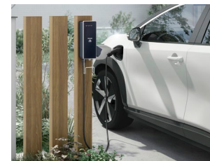
専用ポールと枕木材の組み合わせ

EV充電器は85×150、EVコンセントポールは100角のデザイナーズパーツ枕木材とコーディネート可能。デザイナーズパーツの枕木材と並べて設置することで、住宅に調和しながら、EVのある暮らしを楽しめます。 機能門柱FWへの取り付けも可能です。