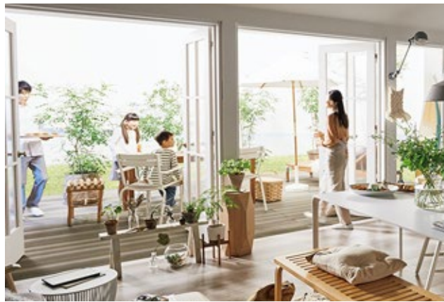
天気の良い休日の朝食はテラスで。キャンパス地の日除けは日差しを和らげ、ナチュラルカラーでコーディネートしたデッキとテラスはお庭のグリーンと調和して居心地のいい空間をつくります。