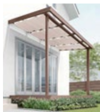
シュエット テラスタイプ