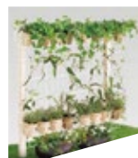
エコリス ウォールメッシュパネル ポットホルダー デザイナーズパーツ 柱材