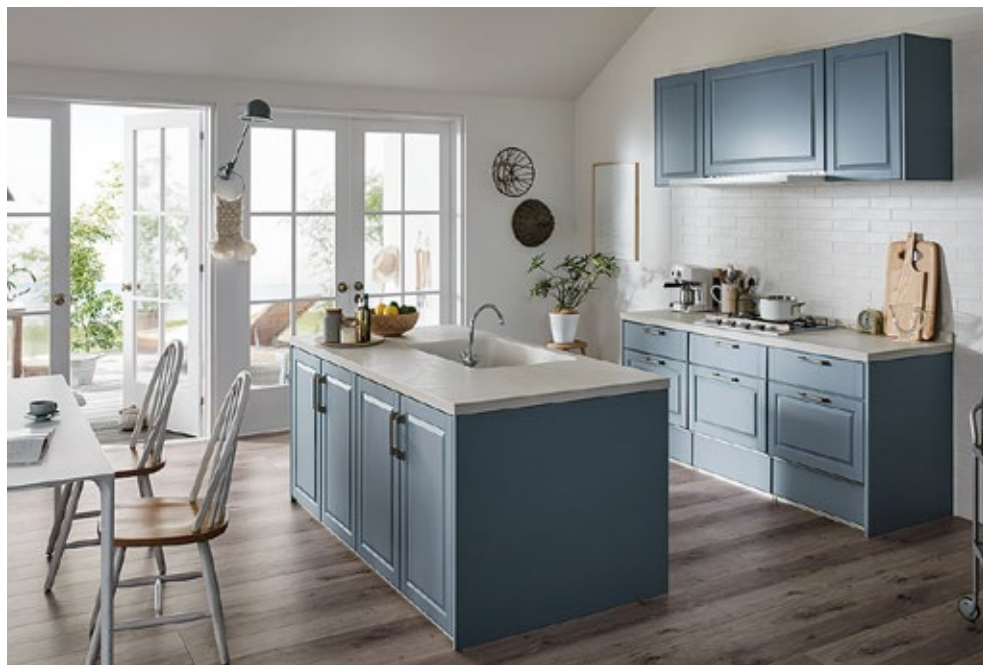
ウッドデッキで 庭とキッチンダイニングをつなげると、セカンドリビングとして使える空間が誕生します。