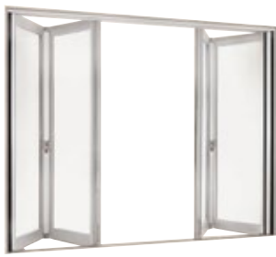
オープンウィン H2400 (フォールディングタイプ)