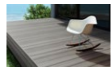
樹ら楽ステージ 木彫