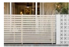
プログコートフェンス (F5型)