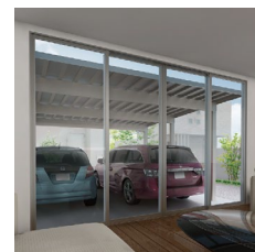
折板屋根のカーポート ※写真はイメージです。

大型で強い台風にも対応できる基準風速V0=44m/sを実現。風の強い地域でも安心です。