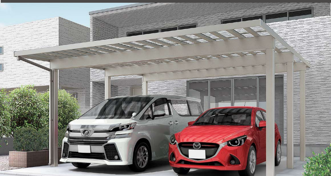
3000 2台用 シャイングレー 54--57型 屋根材色=クリアブルー