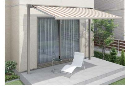
彩風C型+独立フレーム