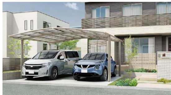
フーゴ R 900 2台用