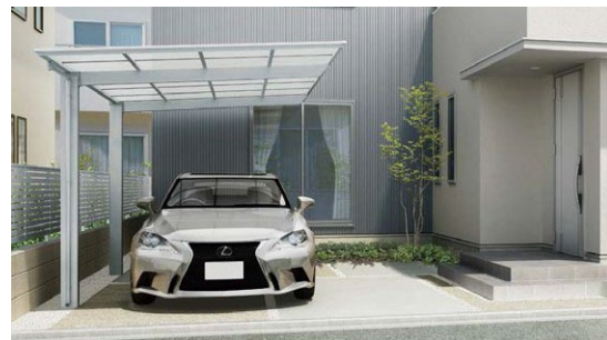
フーゴ F 900 1台用