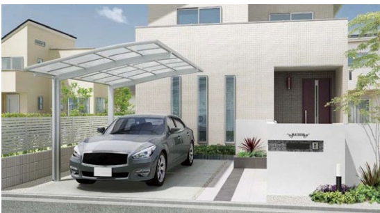
フーゴ R 900 1台用