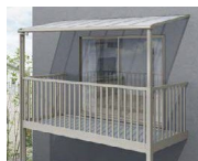
ビューステージHスタイル用屋根タイプ 2階 柱付き