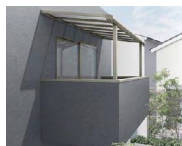
造り付けバルコニー用屋根タイプ 2階 3階 柱付き