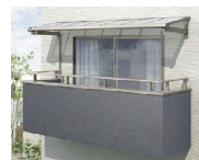
ルーフタイプ 1階 2階 3階 柱なし