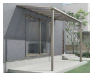
テラスタイプ 1階 柱付き