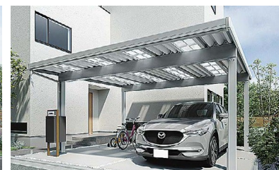
コースペースを明るく有効に