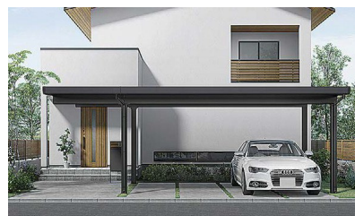
屋根を延長してアプローチと一体化

折板カーポートならではの直線的で骨太なデザインが、ファサード空間を立体的に演出。梁や屋根の延長・連結も可能なため、コースペースを十二分に活かし、使い勝手や意匠性も向上できます。