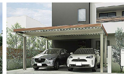
ぬくもりある木調色でファサードをコーディネート