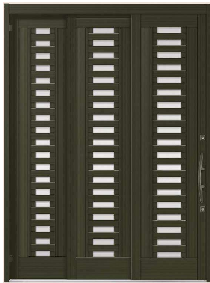
16型 ●オータムブラウン●袖付2枚引