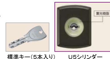
標準キー(5本入り) U5シリンダー

挿入面がすり鉢状なので、鍵が差し込みやすい設計です。鍵穴には夜になると光る蓄光樹脂を使用しています。