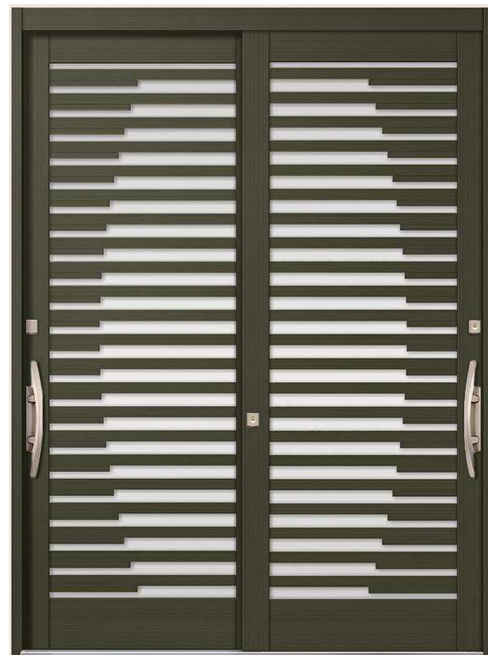
34型/弓 ●オータムブラウン●2枚建戸半外付型

竹や弓など、伝統的な和のモチーフを 現代の解釈でアレンジした「現代和風」、 そしてシンプルで斬新な中にも 和を感じさせ落ち着いた雰囲気 「モダン和風」。新しさの中にも和が息づく 個性の主張できる玄関引戸です。