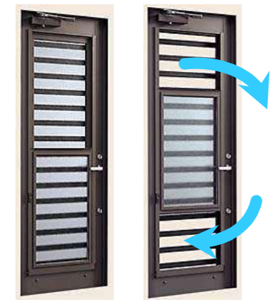
ダブルハング窓 全閉時 ダブルハング窓 全開時

障子の上下を開けることにより、自然対流効果で、新鮮な空気を室内に、湿気や汚れた空気は室外へと、スムーズな換気ができます。