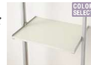
フレーム／棚板セット

フレームとフレームの間には、必ず棚板をご使用ください。パーツは強度上最低、フレーム2本、棚板1セットが必要となります。棚板は1枚入りと3枚入りをご用意しています。