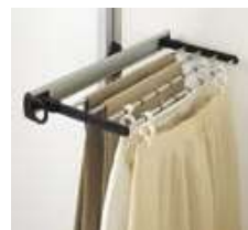
ズボン・スカート掛け