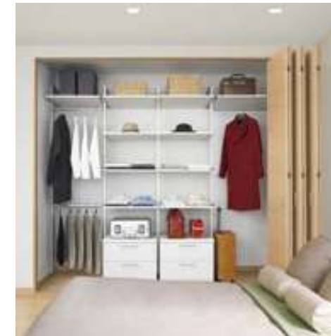
クローゼットプラン