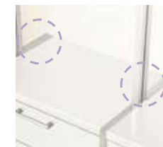
引出し隙間カバー