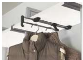
スライドパイプセット