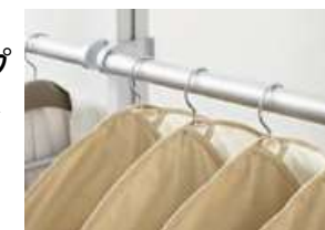
ハンガーパイプセット

ハンガーパイプセットと小物掛けパイプセットをご用意。プランに合わせて高さを調整できます。前後に可動するスライドパイプもあります。