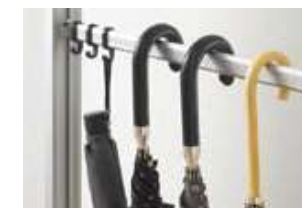
小物掛けパイプセット