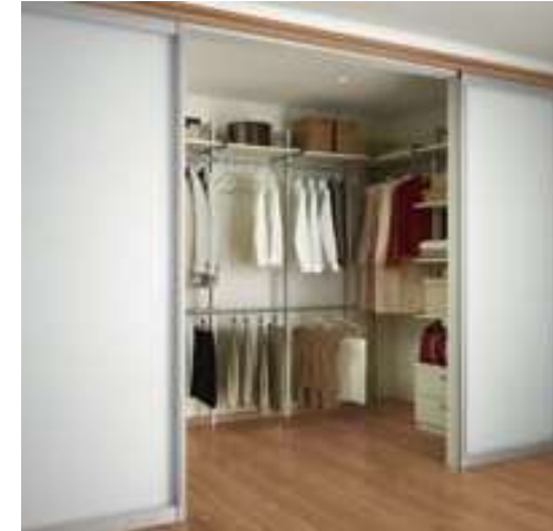
ウォークインプラン