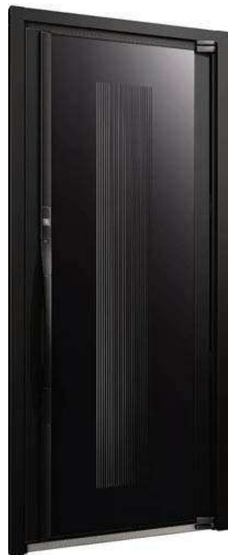
1 2 A型 全面採光ガラス