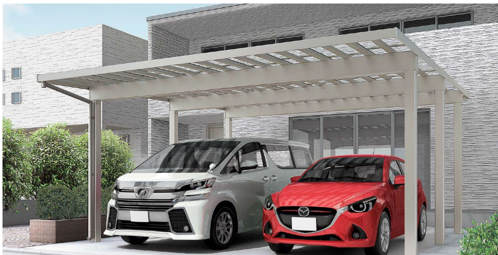
3000 2台用 シャイングレー 54—57型 屋根材色=クリアブルー