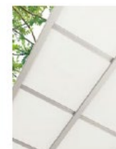
アルミ樹脂複合板 (アイボリーホワイト) 認定No.NM-1961