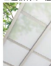
ポリカーボネート板 (クリアマット<すりガラス調>) 認定No.DW-9054