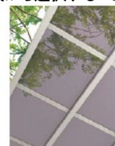
ポリカーボネート板 (クリアブルー<透明>) 認定No.DW-9054