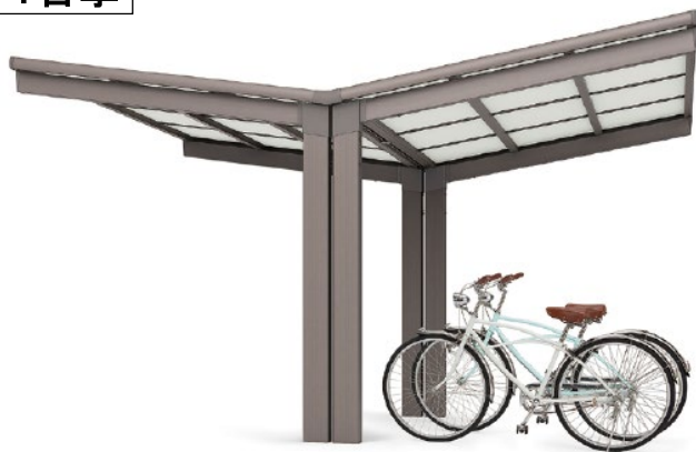
Y合掌 単独タイプ 28型(オータムブラウン・屋根材=アルミ樹脂複合板)