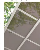
熱線吸収アクアシャイン ポリカーボネート板 (クリアブルー<透明>) 認定No.DW-9054