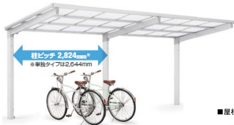
基本 連棟タイプ 57型(ナチュラルシルバーF・屋根材=ポリカーボネート<クリアマット>)