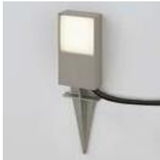
スパイクフットライト