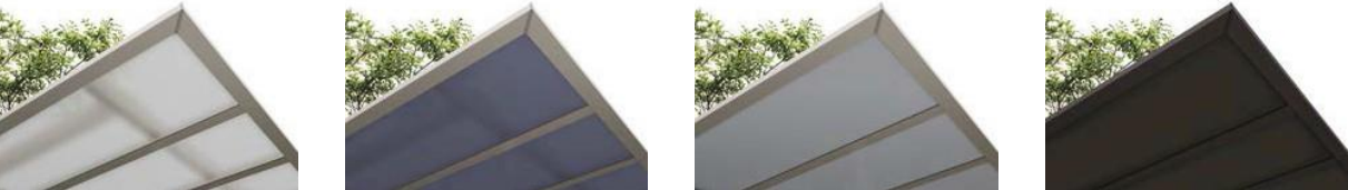
ポリカーボネート板 クリアマット（すりガラス調） 熱線吸収ポリカーボネート板 ブルーマットS（すりガラス調） アルミ樹脂複合板 シルバー（不透明） アルミ樹脂複合板 オータムブラウン（不透明）