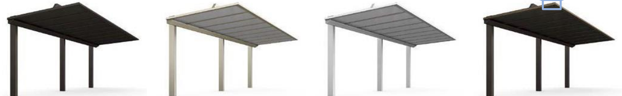
オータムブラウン（屋根材＝アルミ樹脂複合板・オータムブラウン） シャイングレー（屋根材＝アルミ樹脂複合板・シルバー） ナチュラルシルバー（屋根材＝アルミ樹脂複合板・シルバー） オータムブラウン＋柿渋（屋根材＝アルミ樹脂複合板・オータムブラウン）