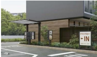
Drive Through 雨や日差しを気にせずに、快適に注文ができます。