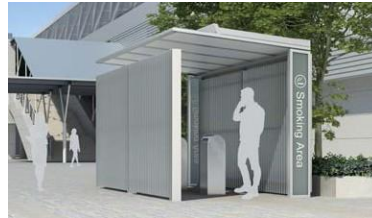
Smoking Area スクリーンフェンスを付けることでオープンスペースにセミクローズのエリアをつくります。