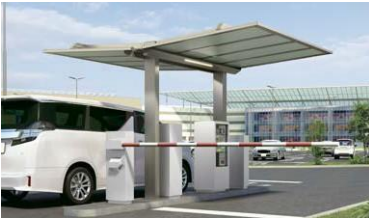
Ticketing Device スペースを有効活用できる、一本柱のY合掌タイプです。

フラットでシンプルなデザインは、オプションやコーディネート商品と組み合わせることで、駐輪場やバス停をはじめさまざまなシーンに対応します。