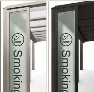
※文字は別手配です。

サインパネル バス停や喫煙所の所在を知らせます。 ポリカサイン ガラスサイン（特注）