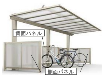
背面パネル 側面パネル パネルの材質は、ポリカーボネート板とアルミ樹脂複合板から選べます。