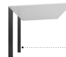
ナチュラルシルバーF+ブラック