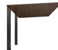
ブラック+クリエモカ