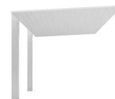
ナチュラルシルバーF