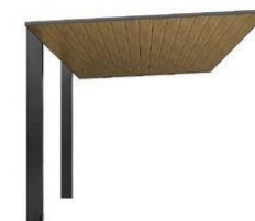
ブラック+チェリーウッド