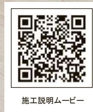
施工説明ムービー

「TY-02D」は基材に環境配慮型針葉樹合板を使用した床材です。 環境配慮型合板基材の床に比べて水分の影響を受けやすい材料ですので、 床材の施工に際し、施工説明書に従い、注意事項を遵守いただけますようお願いいたします。