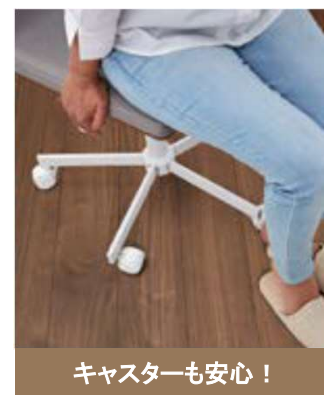
キャスターも安心！

※ 傷やへこみがつかないということではありません。過度の荷重にはご注意ください。 特に金属製や球形状のキャスターは表面を傷めやすいので、ご使用をお避けください。