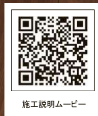
施工説明ムービー

「TY-02S」は基材に環境配慮型針葉樹合板を使用した床材です。 環境配慮型合板基材の床に比べて水分の影響を受けやすい材料ですので、 床材の施工に際し、施工説明書に従い、注意事項を遵守いただけますようお願いいたします。