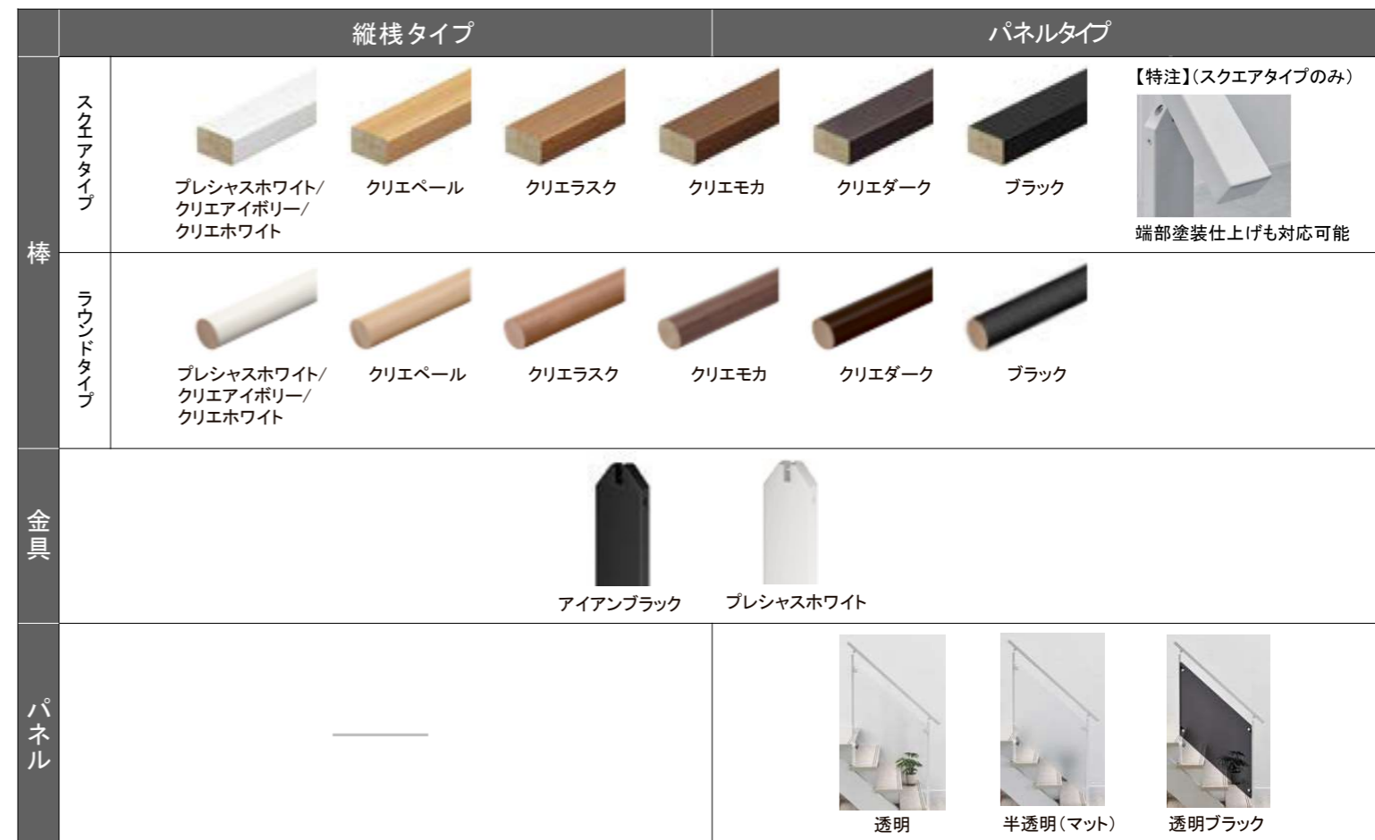
カラーラインアップ