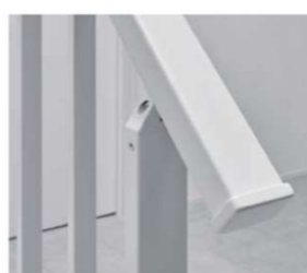
美しい端部塗装仕上げ