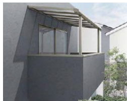
造り付けバルコニー用屋根タイプ