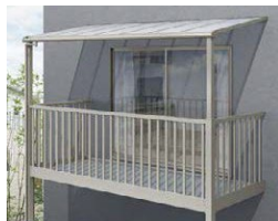
ビューステージHスタイル用屋根タイプ