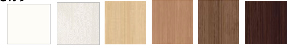
プレシャスホワイト クリエアイボリー クリエパール クリエラスク クリエモカ クリエダーク