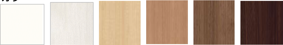
プレシヤスホワイト クリエアイボリー クリエパール クリエラスク クリエモカ クリエダーク