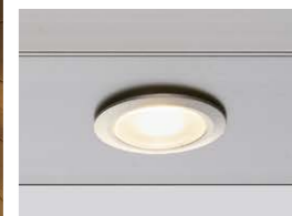
ダウンライト (オプション)