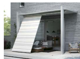
スタイルシェード (オプション)