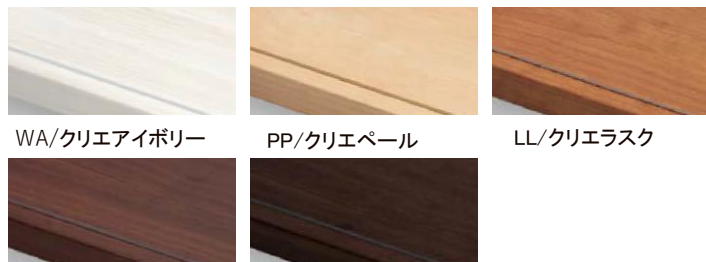
WA/クリエアイボリー