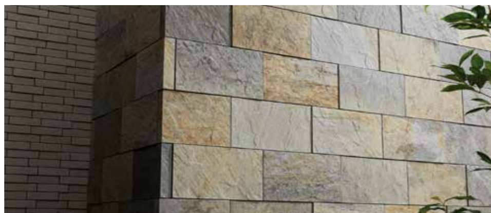
左: HAL-420/STC-JR3, HAL-35B/GRA-R1, 右: HAL-420/STC-JR3, HAL-35B/GRA-R1