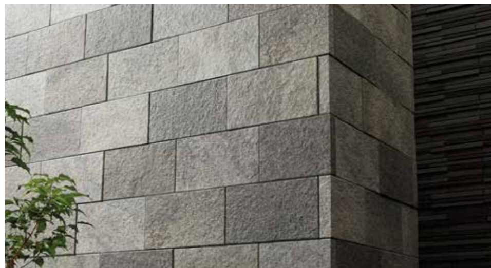
左: HAL-420/STC-QT3, HAL-R/LNS-5, 右: HAL-420/STC-QT3, HAL-R/LNS-5