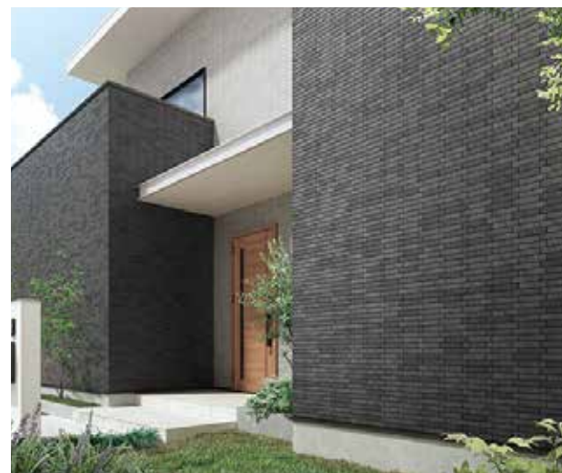
【施工例】[スクラッチ面] HAL-35B/GRA-S3・GRA-S4