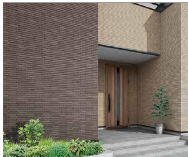
【施工例】[面状ミックス] HAL-35B/GRA-M2・GRA-M3