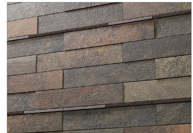
自由な組み合わせで創る、オリジナリティ溢れる外観。