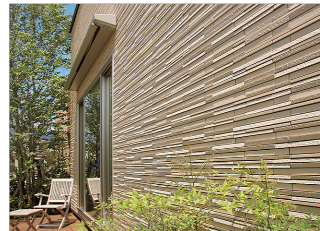
豊かに奏でる陰影が美しい。

豊かな質感、さまざまな形状、多彩なカラーより選べる楽しさがタイルならではの魅力です。