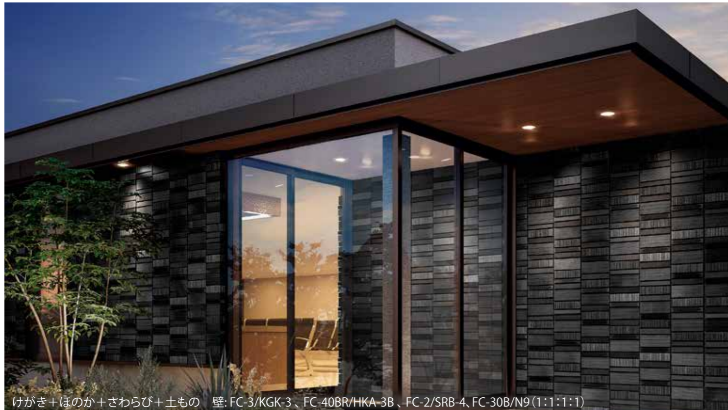
けがき+ほのか+さわらび+土もの 壁: FC-3/KGK-3、FC-40BR/HKA-3B、FC-2/SRB-4、FC-30B/N9 (1:1:1:1)

焼きものらしい質感は、建築物に個性をもたらしながらも都市景観や自然と調和。外壁だけでなくインテリアにもおすすめです。