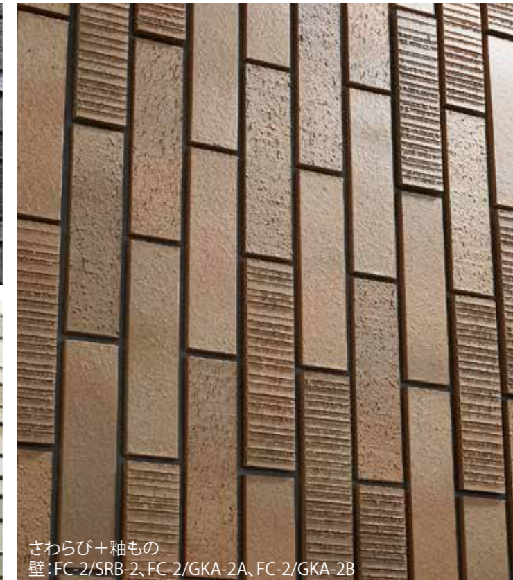
さわらび+釉もの 壁: FC-2/SRB-2、FC-2/GKA-2A、FC-2/GKA-2B