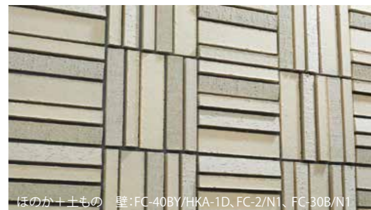
ほのか+土もの 壁: FC-40BY/HKA-1D、FC-2/N1、FC-30B/N1