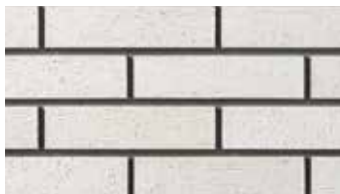
[ラフ面] (ブライト釉)FC-2/GNH-2B