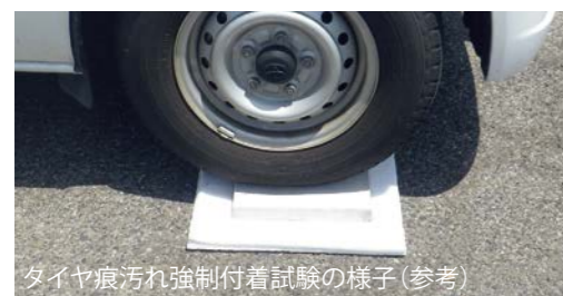
タイヤ痕汚れ強制付着試験の様子(参考)

タイルはコンクリート床面と比べて、タイヤ痕や汚れが付着しにくい特長があります。また、痕や汚れがついた場合も、コンクリート床面と比べて拭き取りやすくなっています。