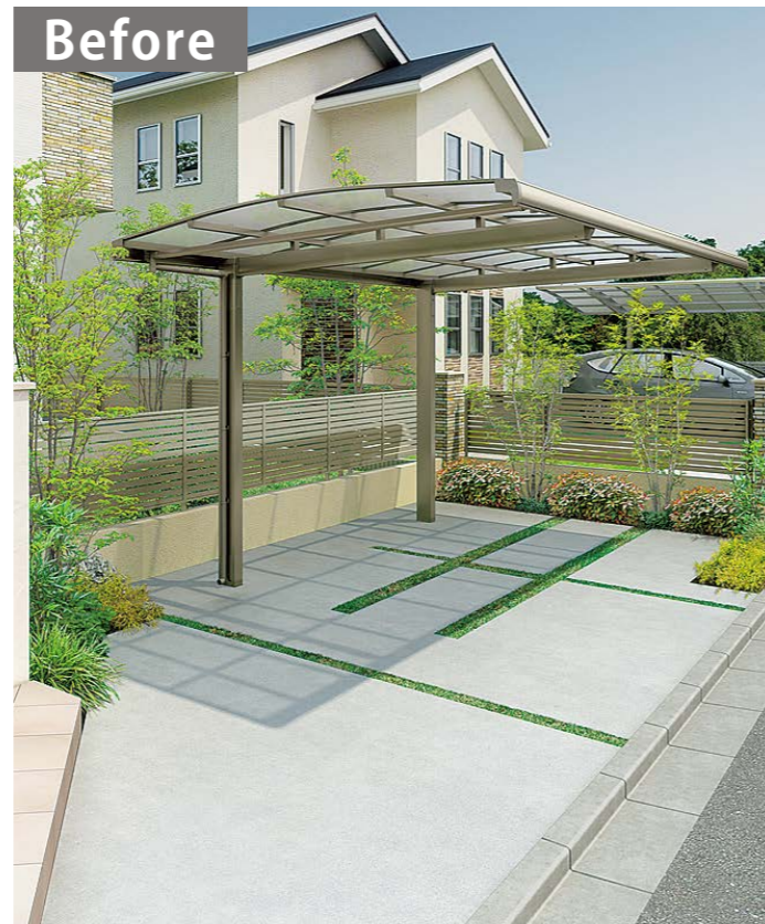
コンクリート施工