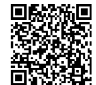
「イナメントHFモルタル」 のご紹介