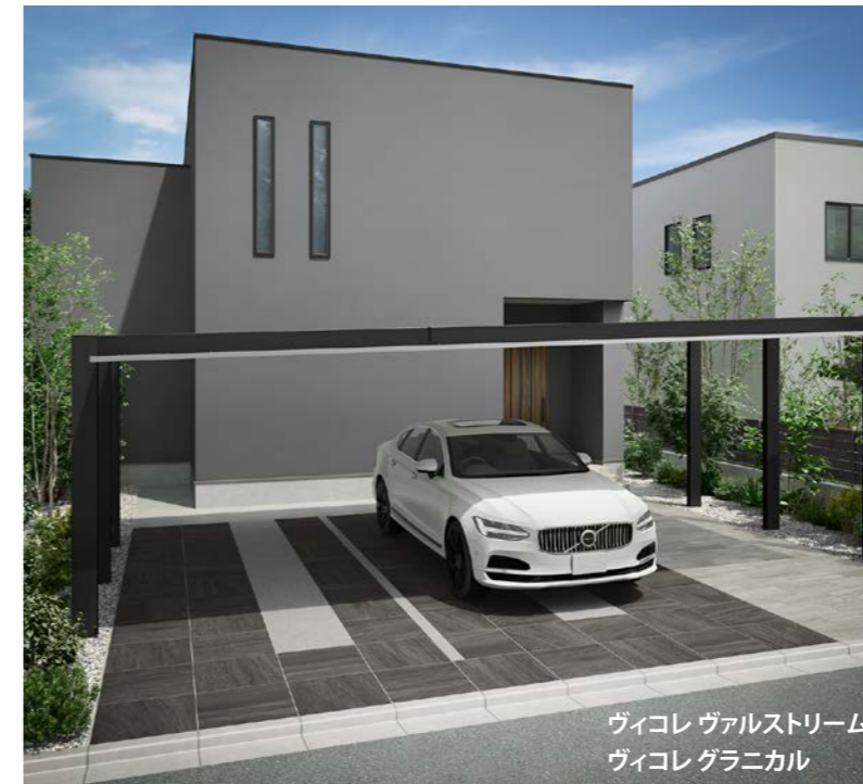
ヴィコレ ヴァルストリーム ヴィコレ グラニカル

通常の約10mm厚の600角や600×300角タイルからも住宅テイストに合わせて選択でき、駐車場に高級感を演出できます。