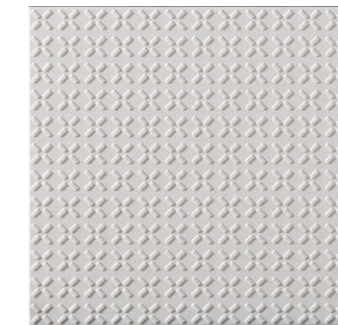
[300mm角歩道用スロープ(Fパターン)]

段鼻と踏面の色にコントラストをもたせ、階段の視認性を高めることができます。色弱のかたはもちろん、転倒の危険に注意を向けやすくします。