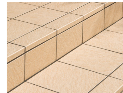
[垂れ付き段鼻納め]

100角・150角・300角形状に『垂れ付き段鼻』&『段鼻』(平段鼻)の両アイテム設定!