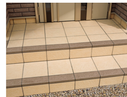
[平と段鼻の輝度比で視認性を向上]

長寿命住宅では、住む人の変化も考えユニバーサルデザインを取り入れることも重要です。