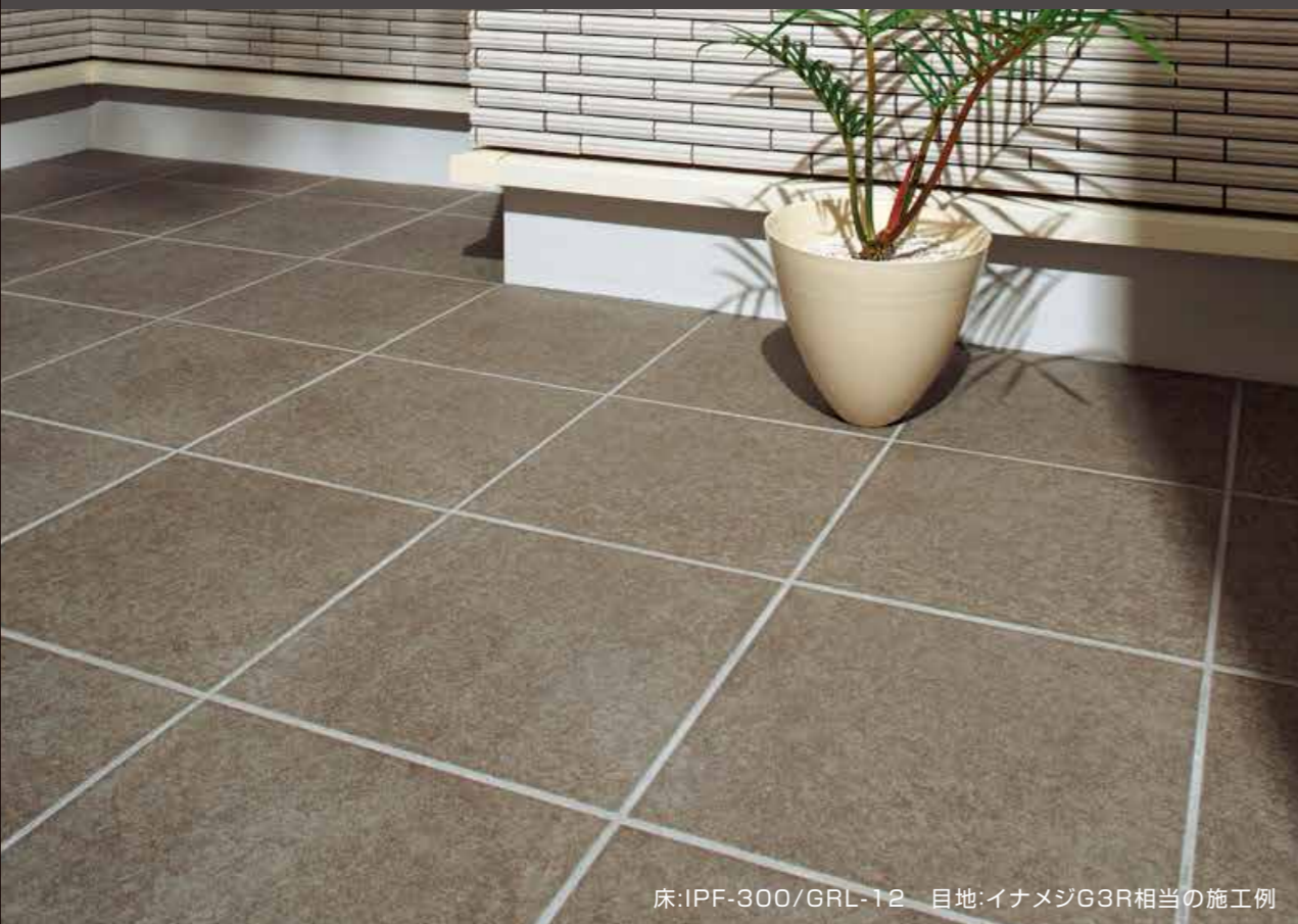
床:IPF-300/GRL-12 目地:イナメジG3R相当の施工例