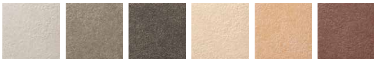
IPF-300/GRL-11 IPF-300/GRL-12 IPF-300/GRL-13 IPF-300/GRL-14 IPF-300/GRL-15 IPF-300/GRL-16