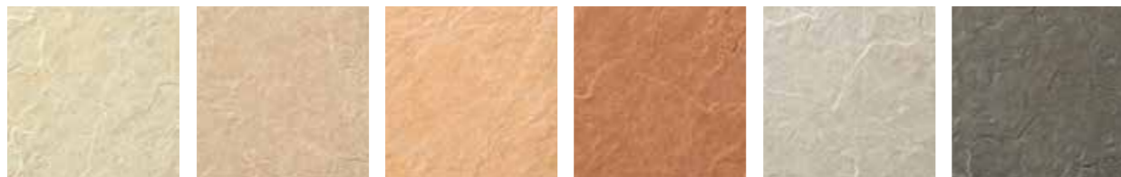
IPF-300/GRL-1 IPF-300/GRL-2 IPF-300/GRL-3 IPF-300/GRL-4 IPF-300/GRL-5 IPF-300/GRL-6