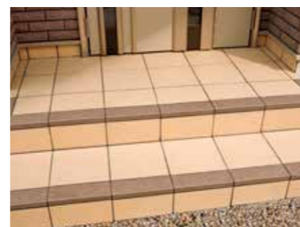
[平と段鼻の輝度比で視認性を向上]

長寿命住宅では、住む人の変化も考えユニバーサルデザインを取り入れることも重要です。