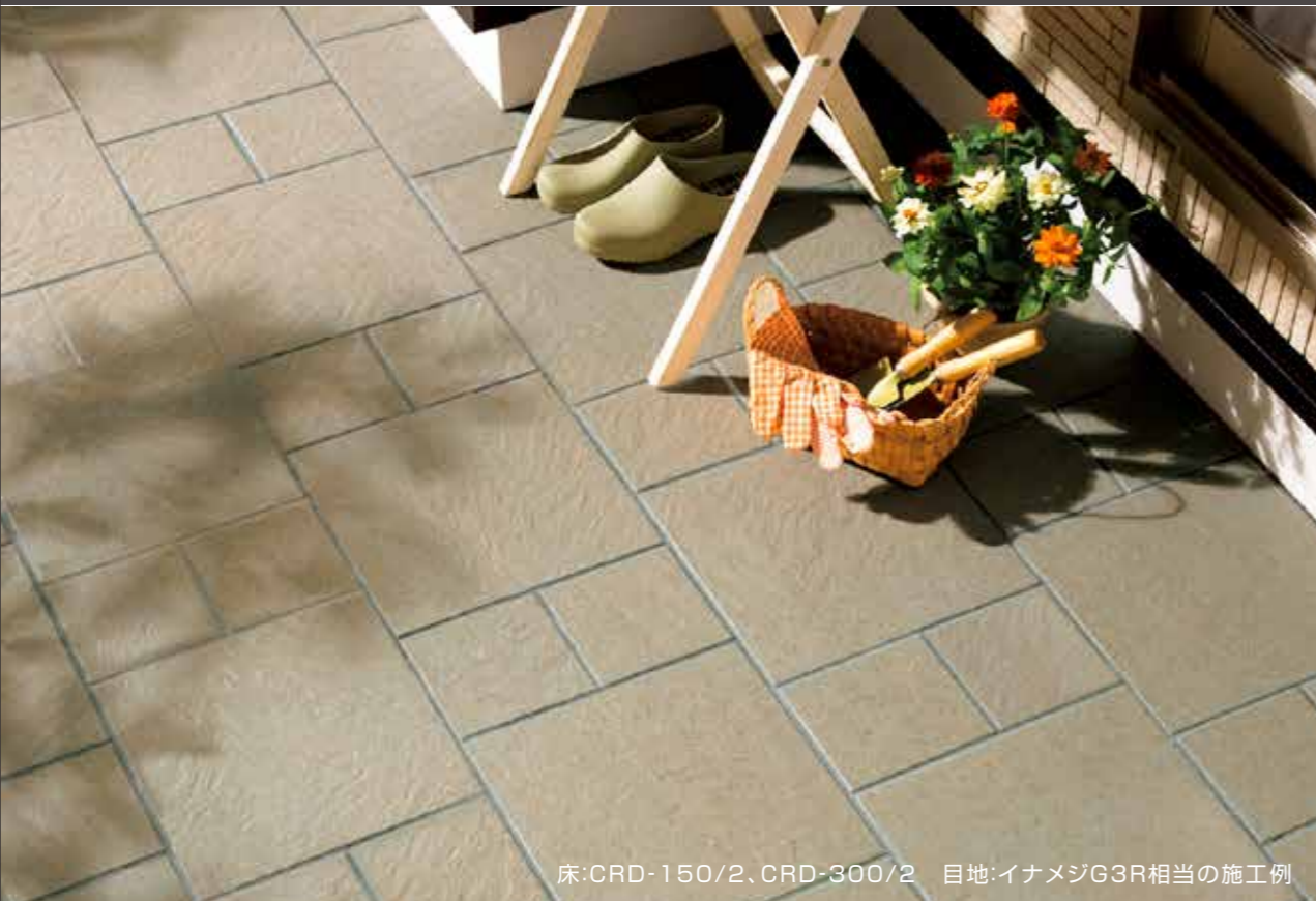
床:CRD-150/2、CRD-300/2 目地:イナメジG3R相当の施工例