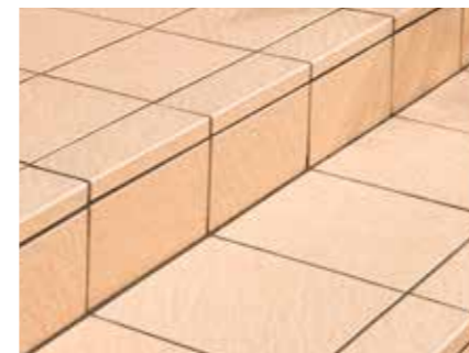
[垂れ付き段鼻納め]

垂れ付き段鼻アイテムを使うことで見た目に重厚な仕上がりになります。 また、段鼻部の色を変えて視認性のアップも図れます。