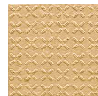
[150mm角歩道用スロープ]

段鼻と踏面の色にコントラストをもたせ、階段の視認性を高めることができるカラーバリエーションを揃えています。 色弱のかたはもちろん、転倒の危険に注意を向けやすくします。