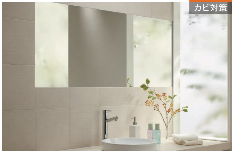
施工例：シルクリーネ/SLA2N