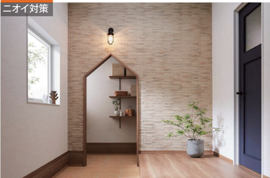
施工例：カームウッド/CWD2N