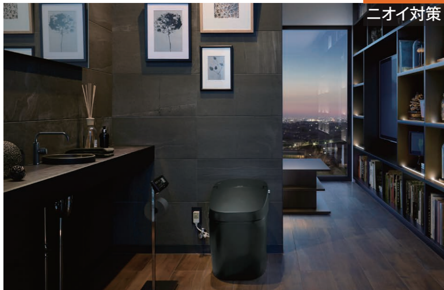
施工例：ストーングレース/STG3N