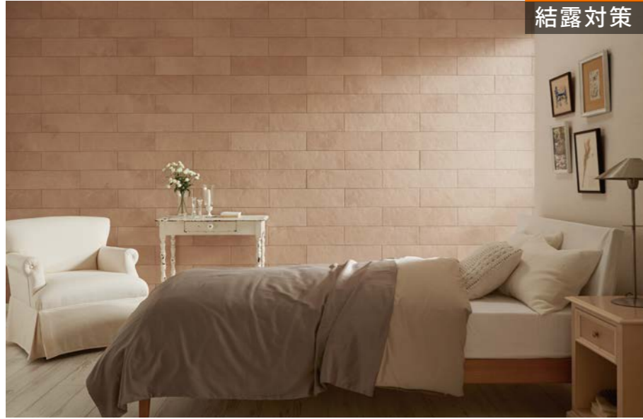
施工例：アンティークマーブル/AMB3N相当