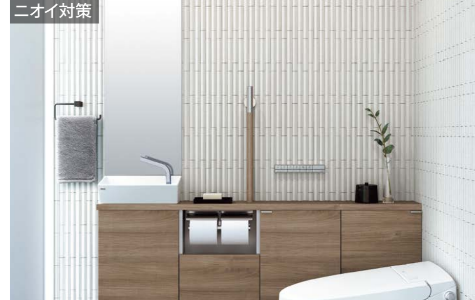
施工例：グラナス ライン/GLN1