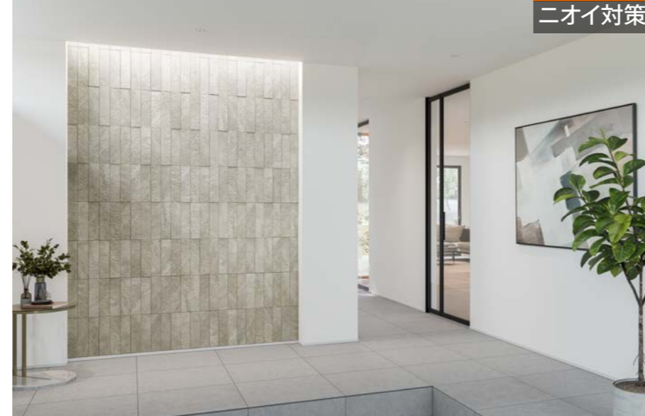
施工例：リブスレート/RSL2