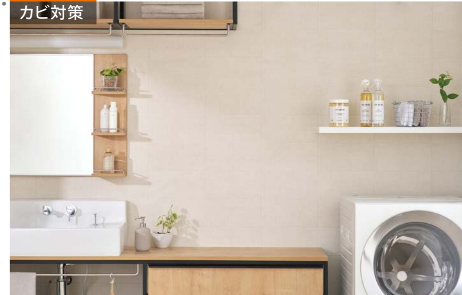
施工例：ルランジュ/LLG1

料理やペットの気になるにおいを減らし、快適な湿度を保とうとするエコカラットプラス。リビングやダイニングは住まいの中心だからこそ、空気から幸せな空間へ。