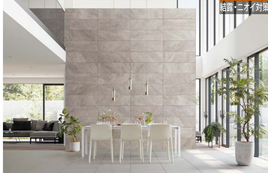
施工例：マジスティックスレート/MAJ2

空気がこもりやすい玄関は、湿気やにおいがこもりやすい。玄関は家の第一印象になるから、エコカラットプラスというおもてなしを。