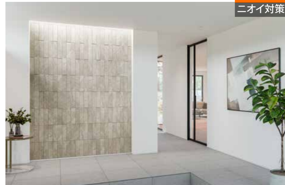
施工例：リブスレート/RSL2