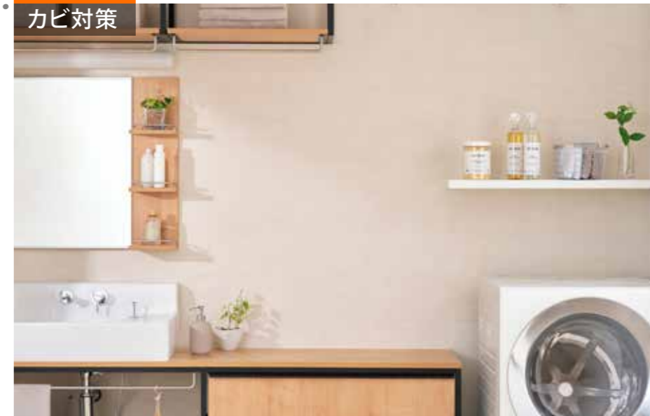
施工例：ルランジュ/LLG1

料理やペットの気になるにおいを減らし、快適な湿度を保とうとするエコカラットプラス。リビングやダイニングは住まいの中心だからこそ、空気から幸せな空間へ。