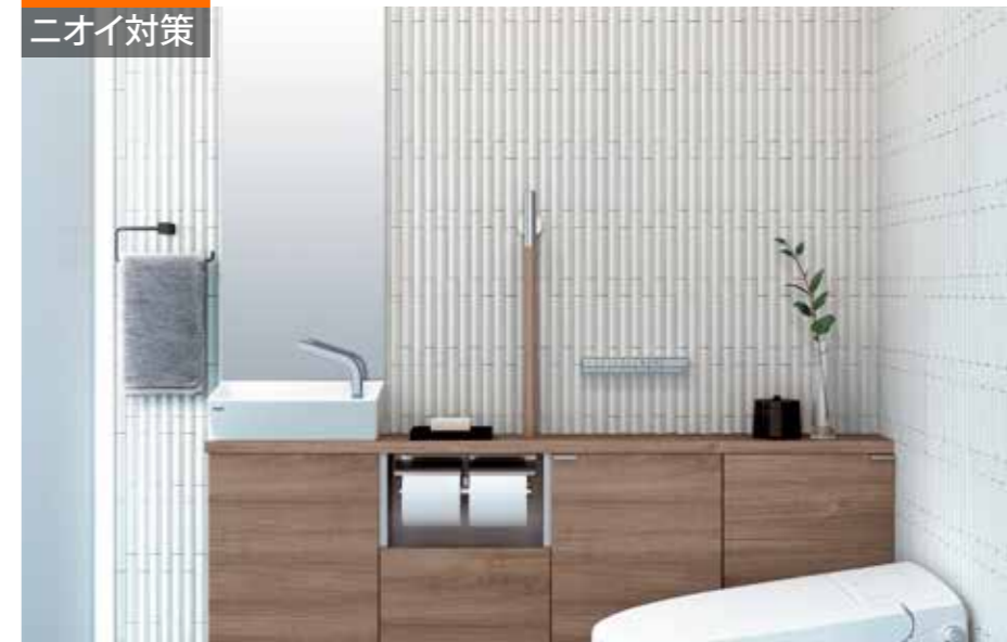
施工例：グラナス ライン/GLN1