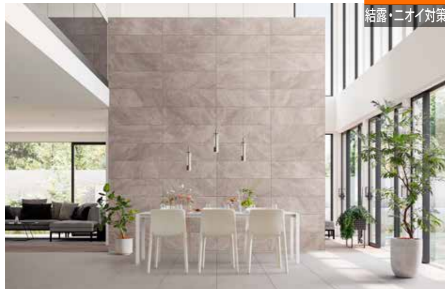
施工例：マジスティックスレート/MAJ2

空気がこもりやすい玄関は、湿気やにおいがこもりやすい。玄関は家の第一印象になるから、エコカラットプラスというおもてなしを。