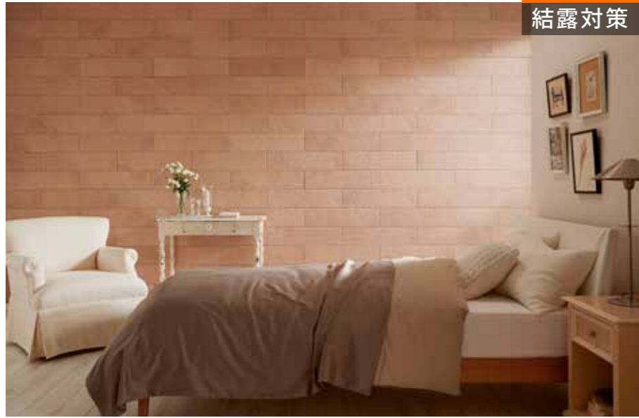
施工例：アンティークマーブル/AMB3N相当