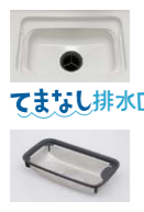
てまなし排水口 ゴミカゴ