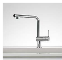
ハンドシャワー水栓 ミント