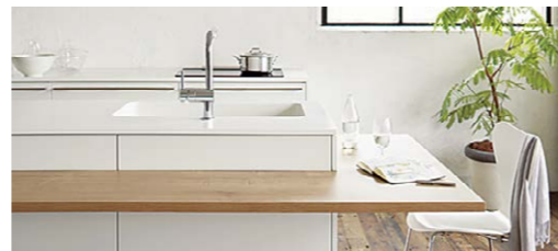
【キッチンテーブル Lタイプ】

料理する、食べる、くつろぐがひとつになった新しい生活スペース。暮らしの幅が広がります。