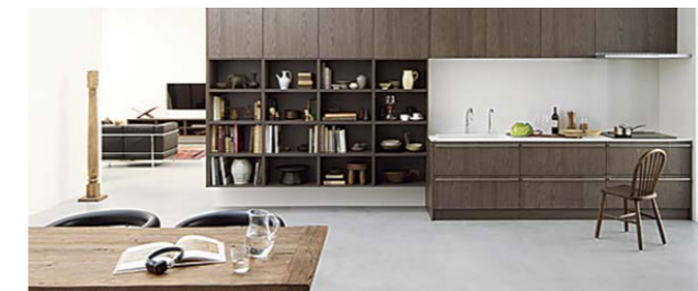
【暮らしを魅せるオープン棚】

オープン棚とキッチンをつなげてレイアウト。愛着のあるものに囲まれた暮らしを実現できます。