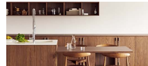
【キッチンテーブル Iタイプ】

キッチンの側面に家族4~5人のテーブルを接続したIタイプ。みんなが集まるホームパーティーもおてのもの。