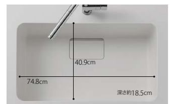
人造大理石シンク カラー:ホワイト