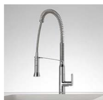
キッチンシャワー水栓 K7