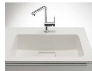
【人造大理石シンク】