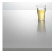
人造大理石トップ カラー:テンドーホワイト