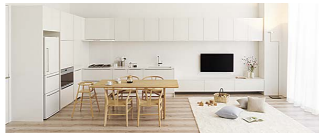
【空間を自然につなぐ壁面収納】