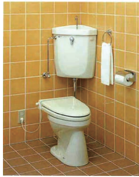
タンクと便器が別々の洗落とし便器が主流