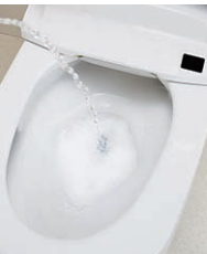
男性立ち小用時の尿ハネを軽減する泡クッション機能が登場