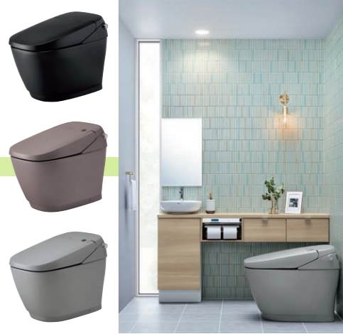
シックなノーブルブラック、上品なノーブルトープ、ナチュラルなノーブルグレーを追加しトイレをとっておきの空間へ