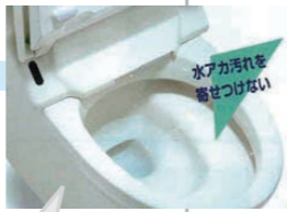
水アカを寄せ付けないプロガード加工が始まる