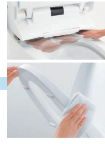
汚れが付きにくくお掃除ラクラクな機能が次々登場