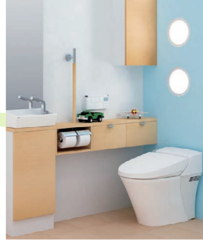
トイレはインテリアにもこだわったくつろぎの空間に