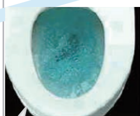
抗菌仕様の便器が登場 汚れにくい便器へ