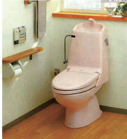
シャワートイレとタンクの一体型が増えデザインもすっきり