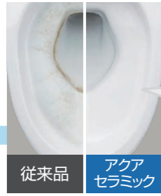
従来品 アクアセラミック