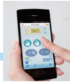
お手持ちのスマートフォンがリモコンに