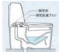
トイレの「臭い」を防ぐ脱臭機能が初登場