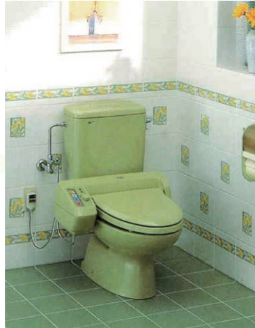
タンクと便器が密着したシャワートイレが登場