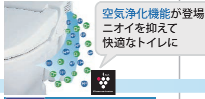
空気浄化機能が登場 ニオイを抑えて快適なトイレに