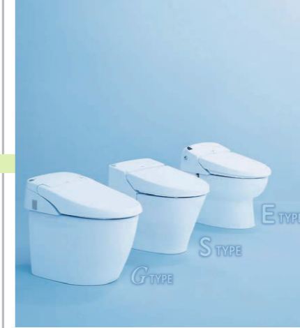
タンクレストイレのバリエーションも増えてさらに進化