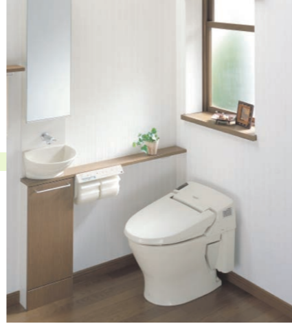
タンクがなくなってコンパクト+トイレ手洗のセットが主流に