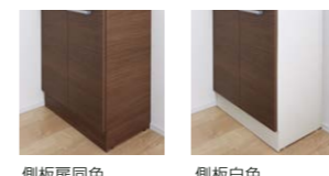
側板扉同色 側板白色