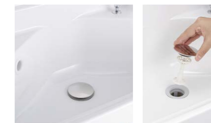
ヘアキャッチャー

髪の毛が絡まず取れてお手入れもカンタン。凹凸が少ないので、ブラシでラクにお掃除できます。