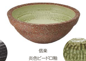
信楽 炎色ビードロ釉