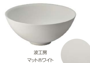
波工房 マットホワイト