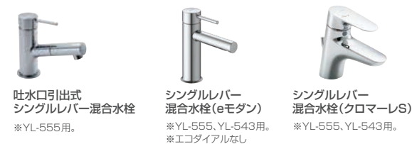
吐水口引出式 シングルレバー混合水栓 ※YL-555用。