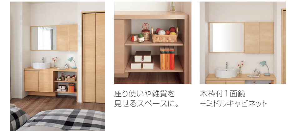
座り使いや雑貨を見せるスペースに。