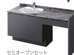
セミオープンセット