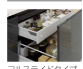
フルスライドタイプ