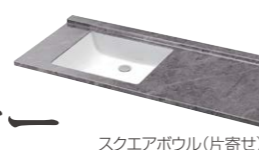
スクエアボウル(片寄せ)