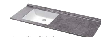
スクエアボウル(片寄せ)