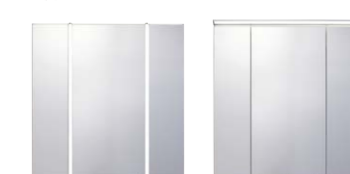
フェイスフルライト (3~5面鏡)