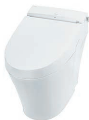
SATIS S TYPE