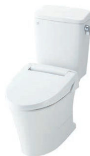
アメージュZ便器 （フチレス）