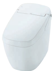
SATIS G TYPE