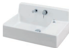
サティス洗面器 YL-537タイプ