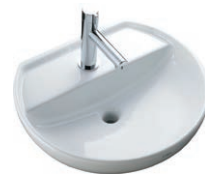
トイレ手洗 キャパシア ベッセル型