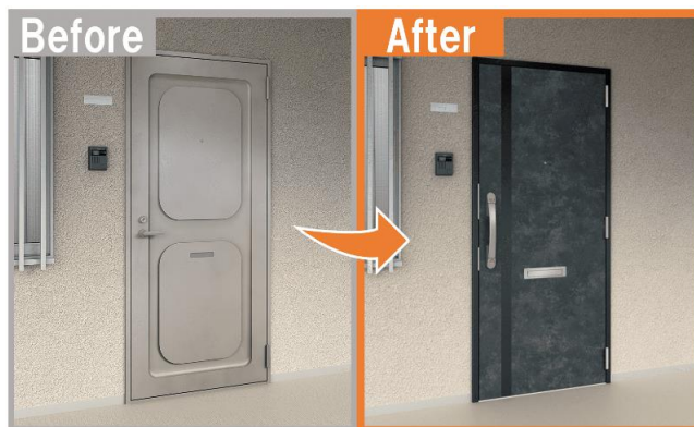
LIXIL 玄関リフォーム リシェントマンションドア