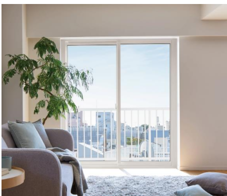
LIXIL 取替窓 リプラスマンション用

また、サッシ・ドアメーカーからも、小規模工事で期間も短くリフォームできる専用商品が発売されていますので、規約改定の検討資料として、ご活用いただければと思います。