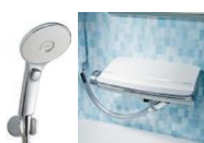
節湯水栓 5,000 円/台