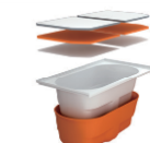
高断熱浴槽 30,000 円/戸