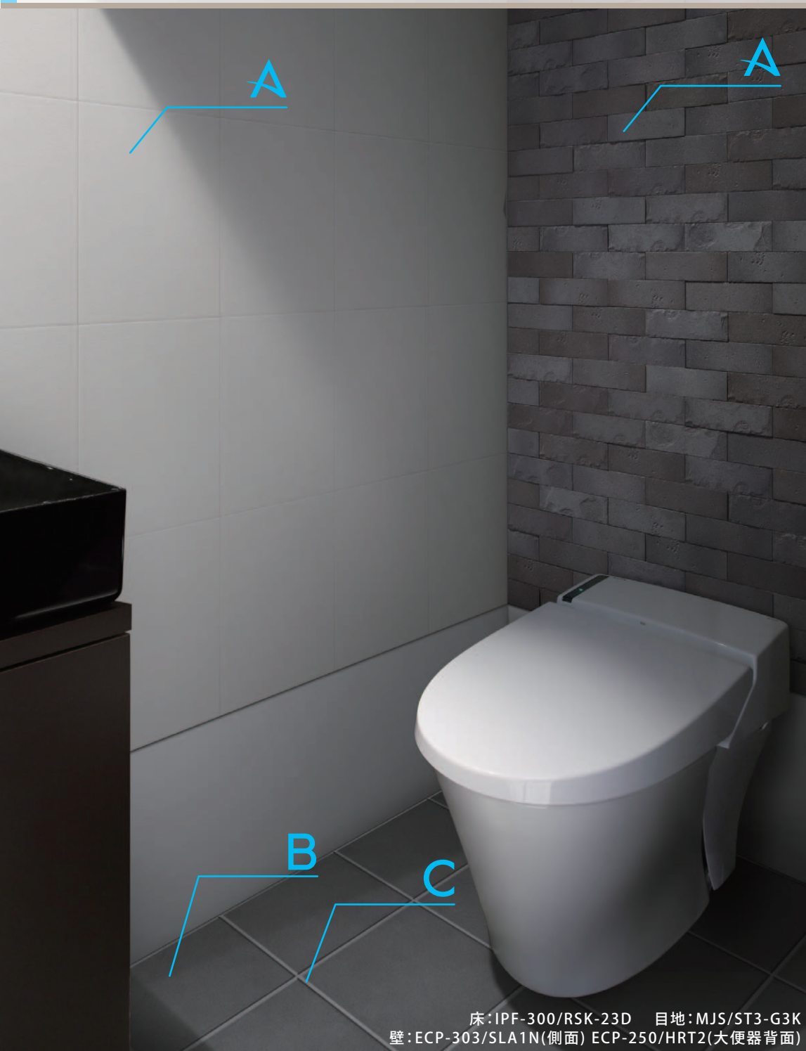
床: IPF-300/RSK-23D 目地: MJS/ST3-G3K 壁: ECP-303/SLA1N(側面) ECP-250/HRT2(大便器背面)