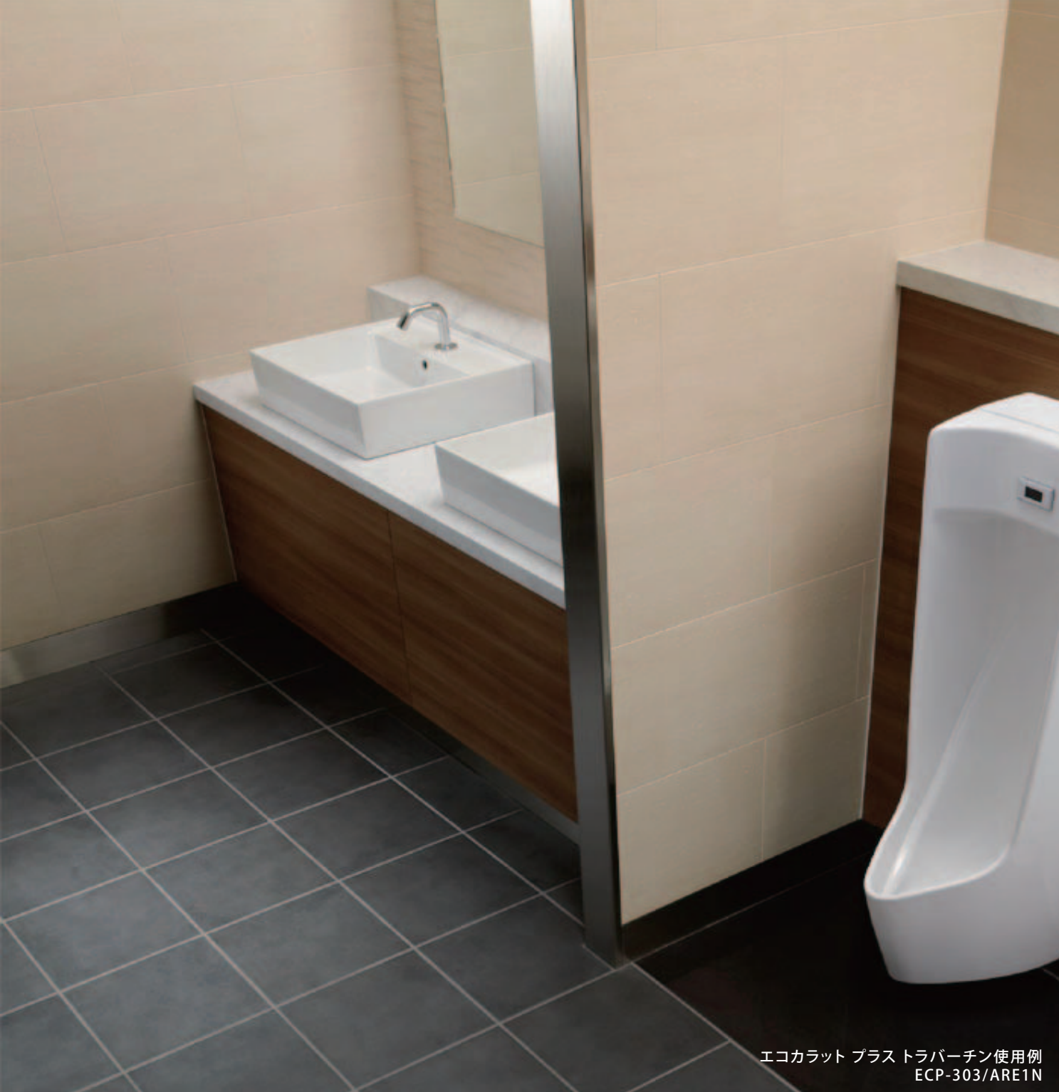
エコカラット プラス トラバーチン 使用例 ECP-303/ARE1N